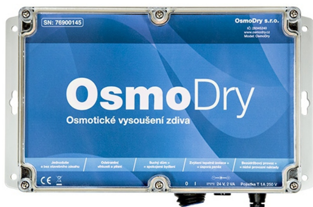
Fotografie přístroje OsmoDry

OsmoDry je přístroj na odvlhčení zdiva, který nevyžaduje stavební zásah a je o 60 % levnější než podřezání zdiva.