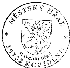
Ing. Jitka Ječná referentka stavebního úřadu

Rozhodnutí má podle § 93 odst. 1 stavebního zákona platnost 2 roky. Podmínky rozhodnutí o umístění stavby platí po dobu trvání stavby či zařízení, nedošlo-li z povahy věci k jejich konzumaci.